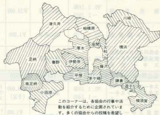
このコーナーは、各協会の行事や活動を紹介するために企画されています。多くの協会からの投稿を希望します。広報委員会