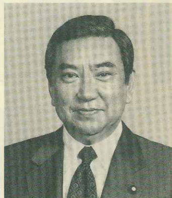
会長 河野 洋平