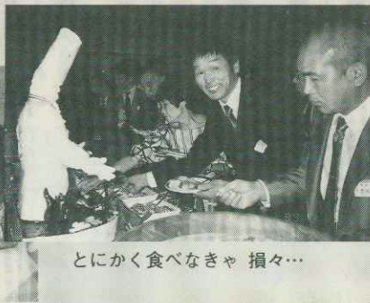
とにかく食べなきゃ損々...