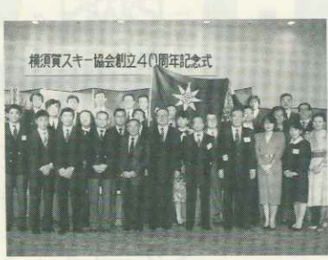
横須賀スキー協会創立40周年記念式

ジュニア育成として実施 本協会は、250名の会員によつて組織され、正・準指導員12名を有していますが、より一層組織活性化をするため、指導者及びジュニアの育成を含め登録会員を増