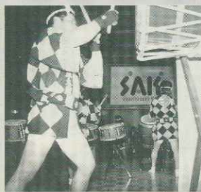
会場に響いた八ヶ岳高原太鼓