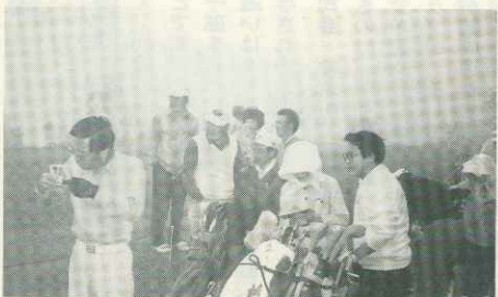
「いやー、まったく見えませんー」

白い朝霧が白樺の木々の間を流れる。流される寒い初秋の早朝、冬のスキー場に集まる見馴れた顔ぶれが、大きな声であいさつを交わしながら、ここ箱根湯の花ゴルフコースに続々と集まってくる。 28日スキー連盟創立50周年を記念してのゴルフコンペが開催された。