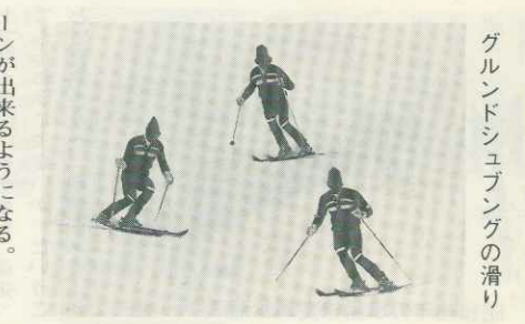
グランドシユブングの滑り