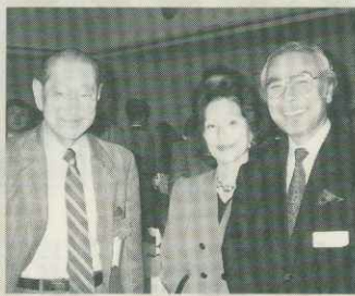
会場のあちこちで交友の輪が広がった。