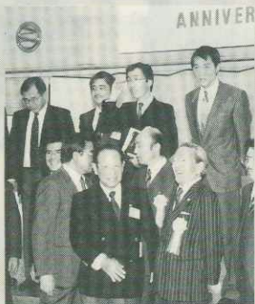
来賓の方たちと記念写真