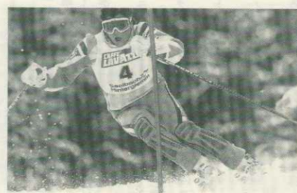
ワールドカップでのトンバの滑り