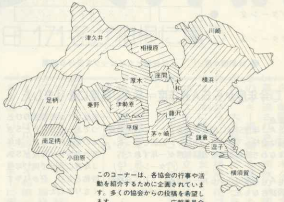
このコーナーは、各協会の行事や活動を紹介するために企画されています。多くの協会からの投稿を希望します。広報委員会