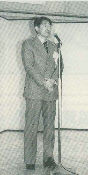
堤 義明 S A J 会長