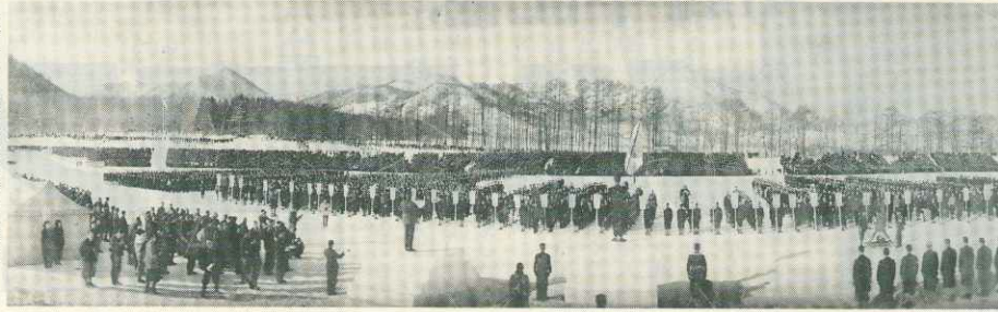
第十一回神宮大会(札幌)の開会式

今、県連50周年を迎え、創設の頃からの史実を知ることが、意味あることです。そこで記念誌の「座談会」の中から、その一部をここに掲載しました。集った方々は、時代の違いはありますが、いずれも県連発展にそれぞれ寄与された方達です。