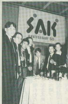
若者集団もちよつとスカしてポーズ